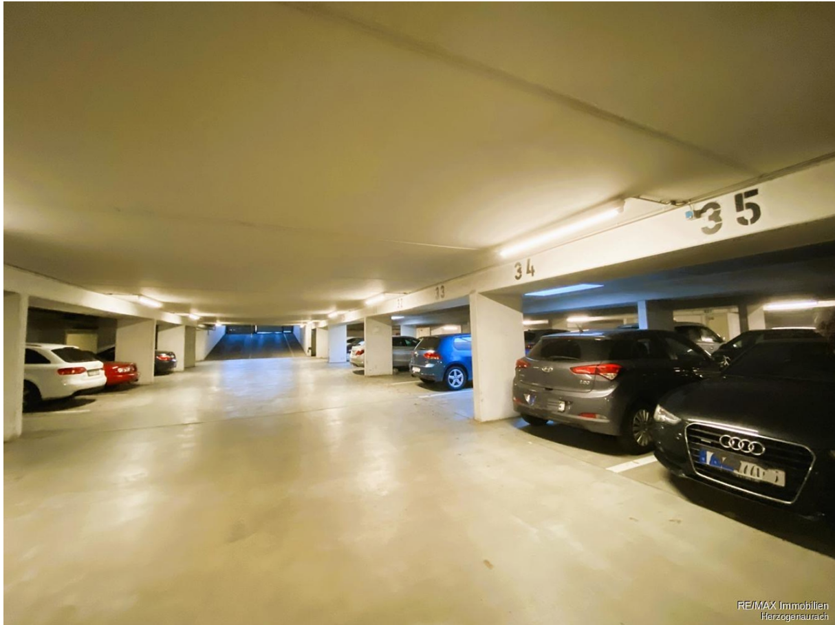
RE/MAX Immobilien Herzogenaurach